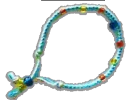
ビーズ編み込みミサンガ