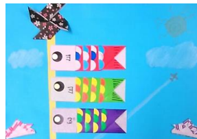
鯉のぼりのカレンダー