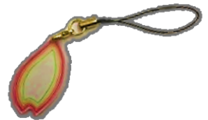
プラ板のストラップ